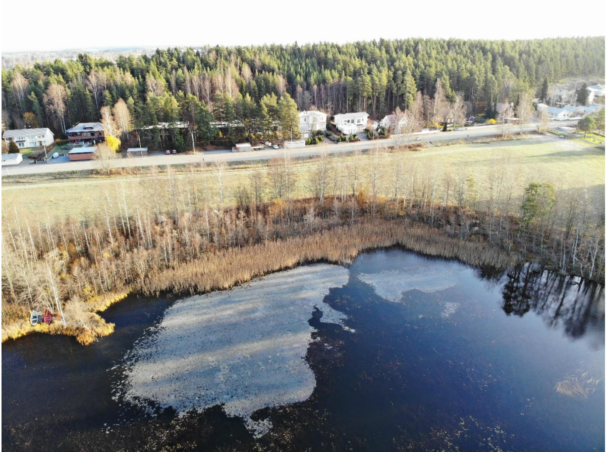
Kuva 5-1. Kevyttä jääpeitettä Tohlopin koillisosan rantavedessä.

Maastokäynnillä 29.10.2019 sää oli aurinkoinen ja pakkasta oli noin -2 °C. Osaan Tohlopin suojausalueista oli muodostunut kevyt jääpeite (Kuva 5-1).