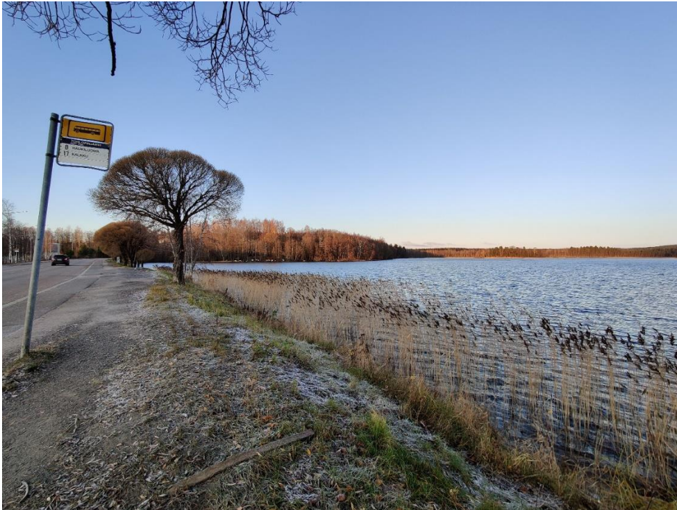
Kuva 5-6. Tohlopin eteläranta on pääosin vesikasvillisuudelta avoin. Muutamassa kohdassa kasvaa harvaa ruovikkoa.

Tohlopin länsiranta on käytännössä kokonaan puustoinen luoteisrannalle sijoittuvaa Tohlopin Tesoman hiekkapohjaista uimarantaa lukuun ottamatta. Puusto jatkuu käytännössä aivan järven rantaviivaan asti, eikä vesikasvillisuutta juurikaan ole (Kuva 5-7).