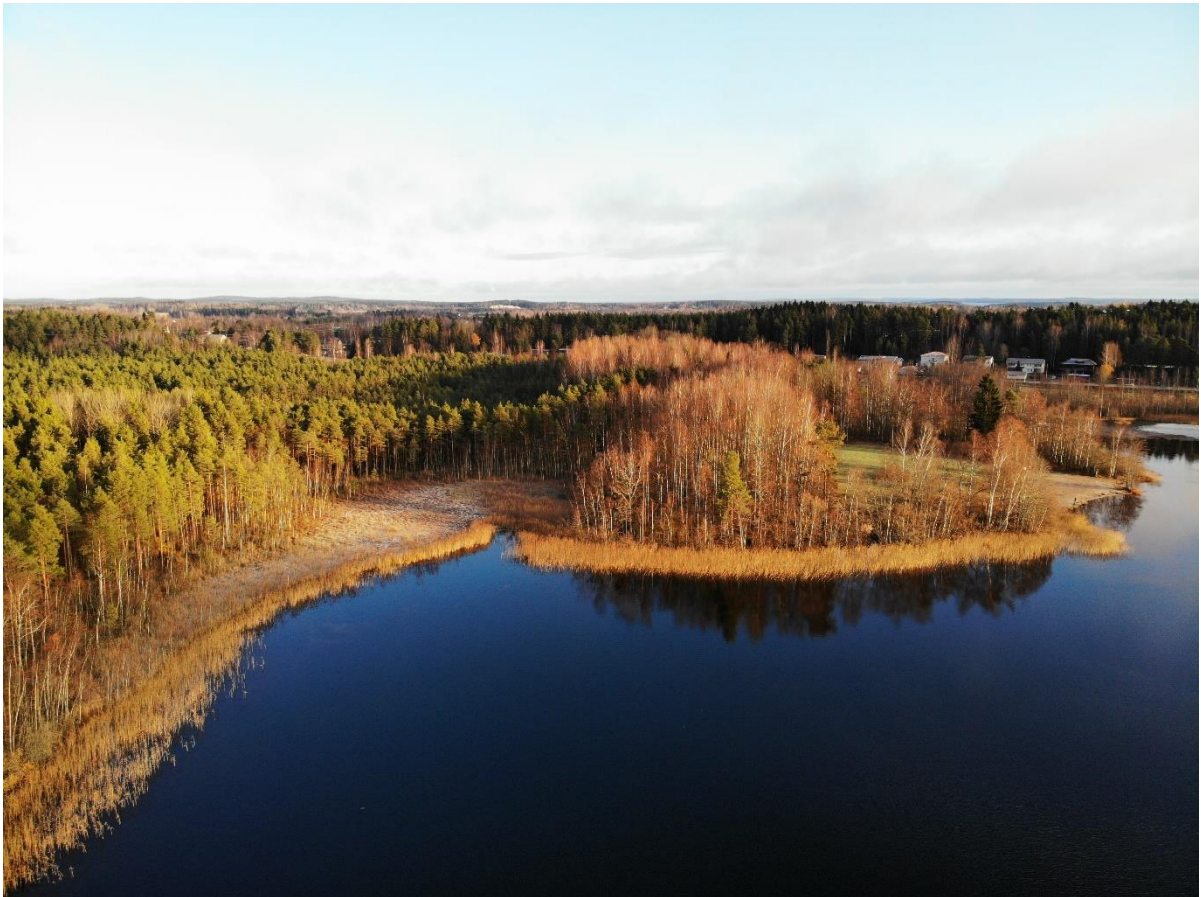
Kuva 5-3. Viitasammakon elinympäristöksi soveltuva rantasuo ja sen molemmille puolille jatkuvat vesikasvillisuuden valtaamat rantavedet Tohlopin pohjoisosassa (Dronekuva 1, ks. Kuva 5-2).

Tohlopin pohjoispäähän sijoittuva rantasuo, sekä sen molemmille puolille jatkuvat vesikasvillisuuden valtaamat rantavedet muodostavat viitasammakolle soveltuvan lisääntymispaikan. Soveltuvaksi arvioitu alue rajautuu rannan puolella pääasiassa mäntyvaltaiseen metsikköön. Alueen itäpuolelle sijoittuu vesikasvillisuudelta paljas hiekkapohjainen Tohlopin Epilänharjun uimaranta.