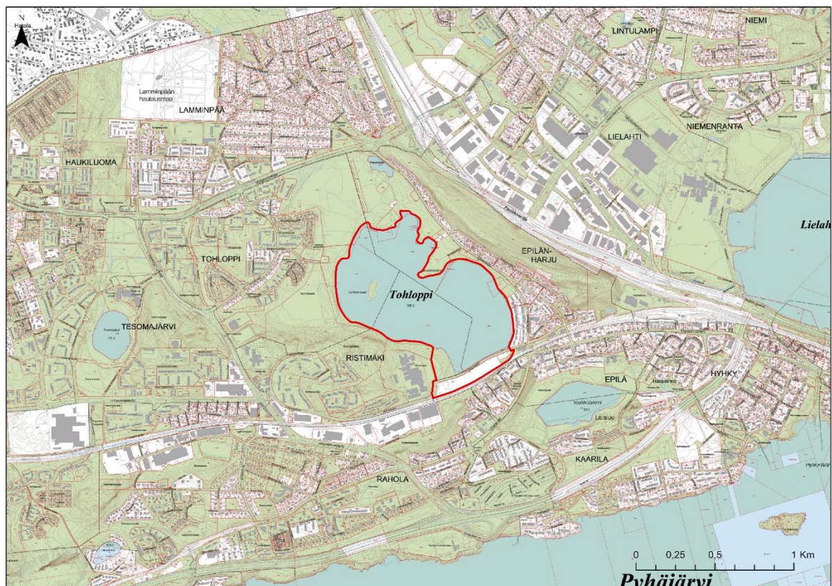
Kuva 1-1. Tohloppi-järven sijainti.

Selvitysalue sijoittuu Länsi-Tampereelle, Epilänharjun länsipuolelle (Kuva 1-1). Selvitysalue kattaa Tohloppi-järven ranta-alueet, ojen välittömästi järveen rajautuvat suot tai suoraan muutosalueella (kaava-alueella) sijaitsevat järveen rajautuvat lampareet. Selvitysalueeseen eivät kuulu Tohloppi-järveen laskevat ojat, rantasoiden painanteet, suot tai ranta-alueen erillislampareet, sillä niihin pääaltaan samentumisella ei ole todennäköisiä vaikutuksia.