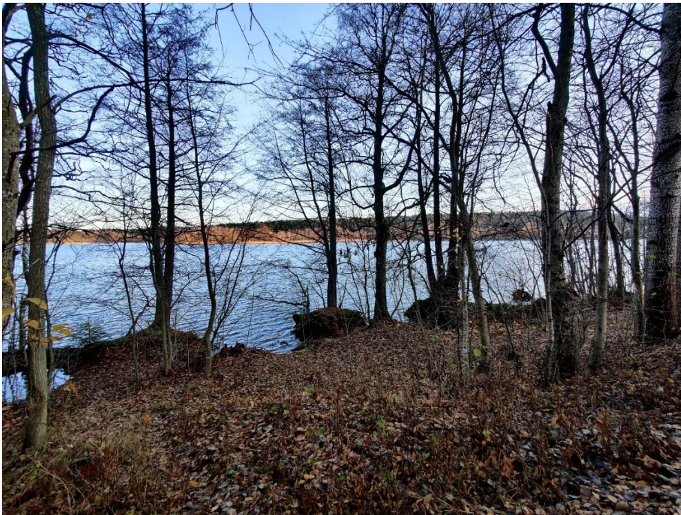
Kuva 5-7. Tohlopin länsiranta on suurimmalta osaltaan karua ja vesikasvillisuudelta vapaata.

Tohlopin länsiranta on käytännössä kokonaan puustoinen luoteisrannalle sijoittuvaa Tohlopin Tesoman hiekkapohjaista uimarantaa lukuun ottamatta. Puusto jatkuu käytännössä aivan järven rantaviivaan asti, eikä vesikasvillisuutta juurikaan ole (Kuva 5-7).