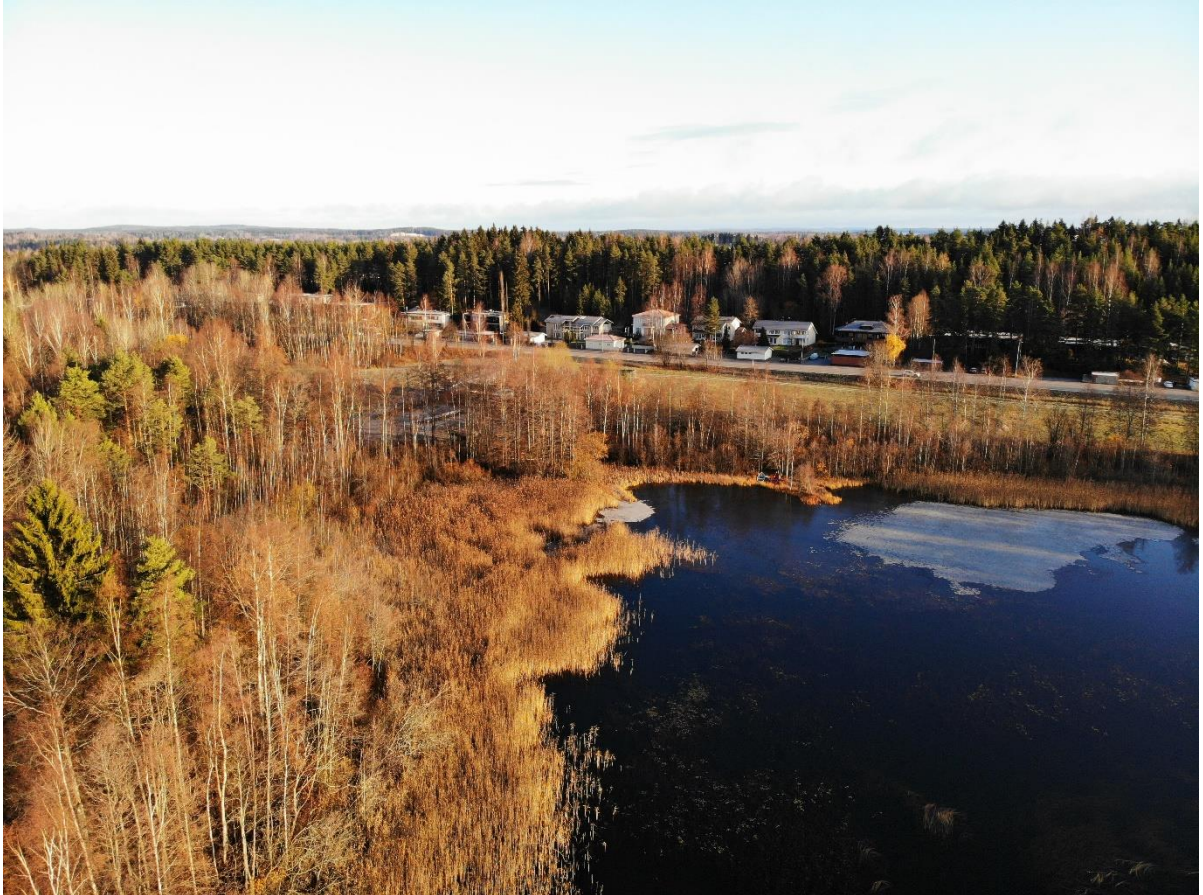
Kuva 5-4. Viitasammakon elinympäristöksi soveltuvaa rantaruovikkoa Tohlopin pohjoisosassa (Dronekuva 2, ks. Kuva 5-2).

Toinen Tohlopin pohjoispäähän sijoittuva viitasammakolle potentiaalinen elinympäristö muodostuu pääasiassa ruovikosta ja lahden pohjukkaan muodostuneesta suoalueesta. Suojainen ruovikko jatkuu jonkin matkaa suoalueesta rannanmyötäisesti etelään. Alueen länsipuolelle sijoittuu vesikasvillisuudelta paljas hiekkapohjainen Tohlopin Epilänharjun uimaranta ja pohjoispuolelle Epilän matonpesupaikka. Ranta on soveltuvan elinympäristön ympärillä puustoinen. Alueen itäpuolella, kapean metsäkaistaleen takana on pelto.