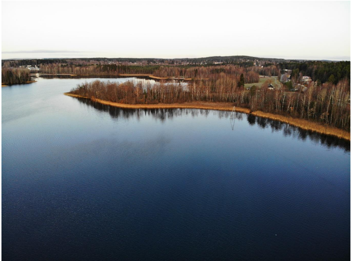
Kuva 5-5. Tohlopin itärantaan sijoittuvaa viitasammakon elinympäristöksi soveltuvaa rantaruovikkoa (Dronekuva 3, ks. Kuva 5-2).

Tohloppi-järven kolmas viitasammakolle soveltuva elinympäristö sijoittuu noin 500 metrin päähän kaava-alueeseen kuuluvasta Tohlopin etelärannasta koilliseen, Mustikkaniemen eteläpuoleiseen rantaan. Alue muodostuu tiheästä, rantavedessä kasvavasta, ruovikosta. Rannassa aluetta reunustaa lehtipuusto. Soveltuvan alueen edustalle, avoimeen veteen, on sijoitettu wakeboarding-kaapelirata.