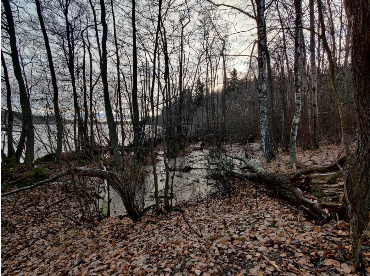
Kuva 5-8. Tohlopin länsirannan metsiin on paikoin muodostunut vetisiä lampareita.

Järven lounaiskulman metsikköön (kaavan VL-2 alue) ja pienialaisesti myös muihin länsirannan metsiköihin on muodostunut tulvalampareita (Kuva 5-8). Lampareet ovat kuitenkin melko matalia ja voivat kuivua kesän mittaan, joten niiden ei arvioida muodostavan viitasammakolle soveltuvaa lisääntymispaikkaa.