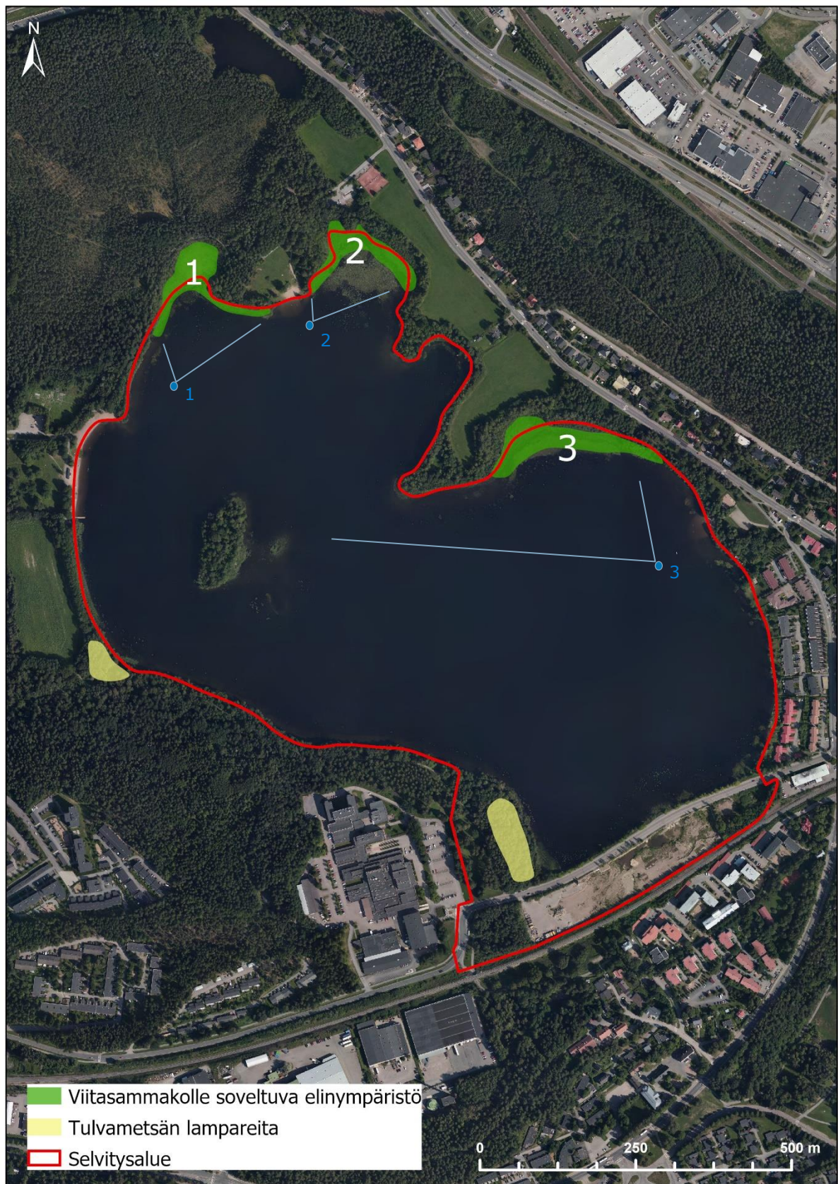
Kuva 5-2. Viitasammakolle soveltuvat elinympäristöt selvitysalueella, sekä dronen arvioitu sijainti ja kameran kuvakentän suuntautuminen kuvanottohetkellä.