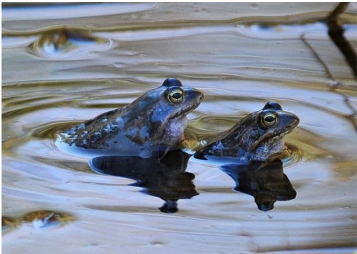
Kuva 3-1. Kutevat viitasammakot.

Viitasammakon kutu alkaa etelässä huhti-toukokuun vaihteessa, jolloin sammakot kokoontuvat suurina joukkoina kutualueille (Kuva 3-1). Kutu on vilkkaimmillaan öisin. Kutumenot kestävät useita vuorokausia, ja niiden lopuksi naaras laskee 500-2000 munaa muutamana klönttinä, jotka painuvat pohjaan ja jäävät sinne. (Jokinen 2012)